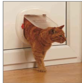
Gatti grandi / Cani piccoli Fino a 10 kg