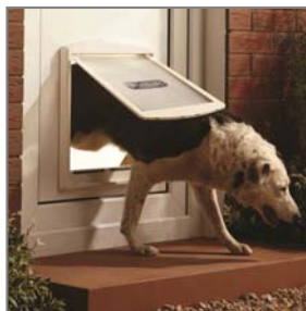
Cani grandi fino a 45 kg