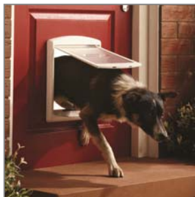
Cani di media taglia fino a 18 kg