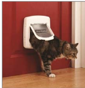
Gatti Fino a 7 kkg

La gamma di prodotti comprende modelli da porte di piccole dimensioni per gatti fino a porte per cani di un peso fino a 100 kg. Ci sono 5 dimensioni: